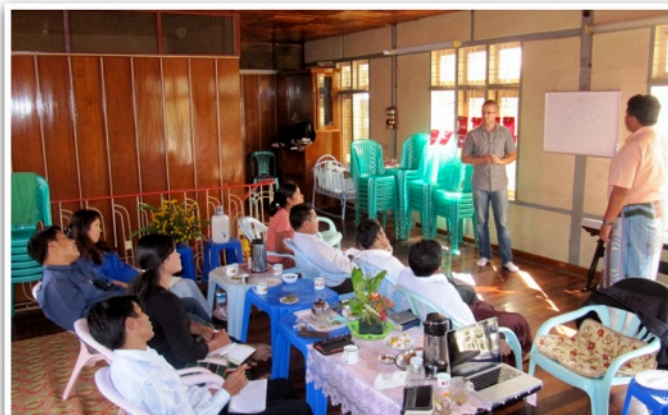
Undervisning för vårt burmesiska team.