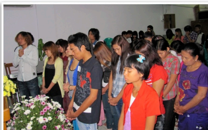
Nya troende blir andedöpta under en Gudstjänst.