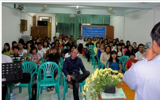
Gudstjänst i vår församling i Mandalay City