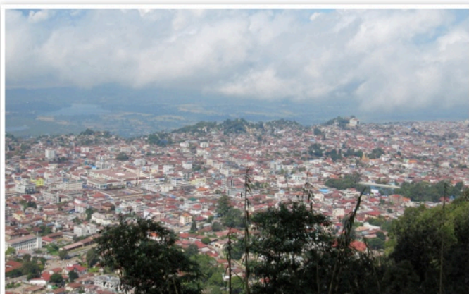
Vy över Tawaggyi där vi nu startar en ny kyrka!